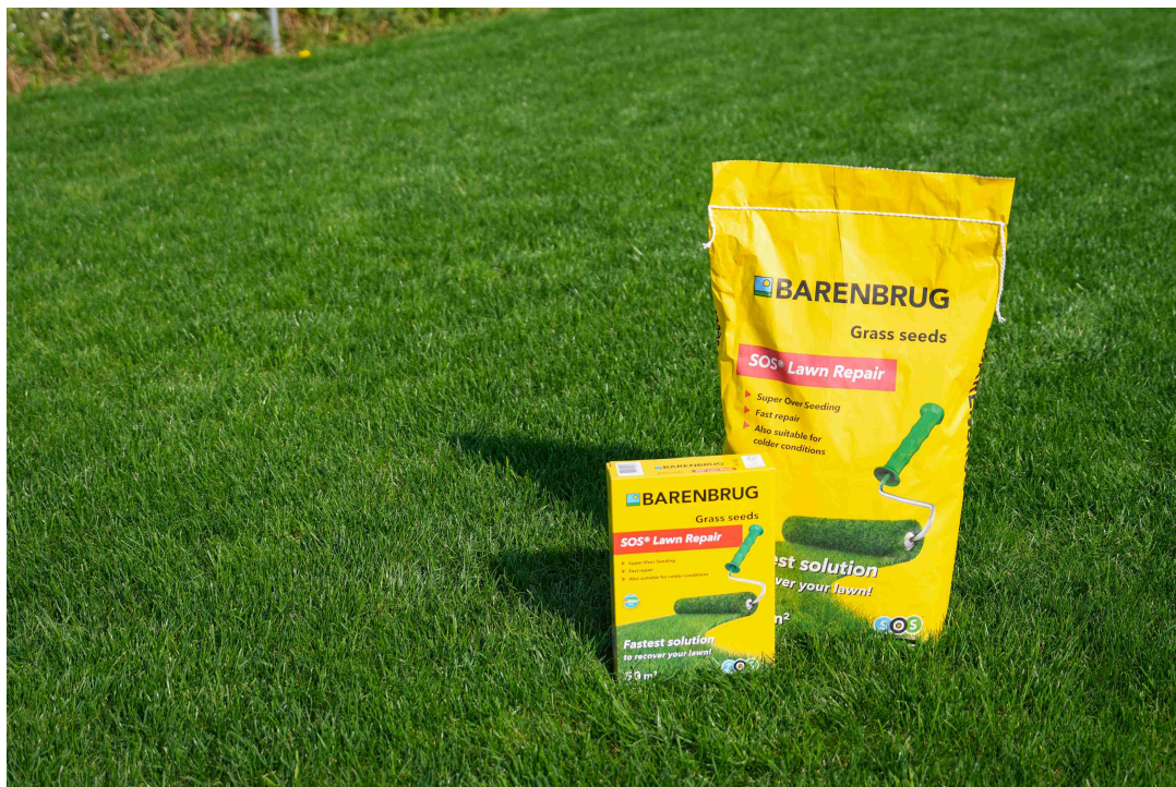
SOS® LAWN REPAIR